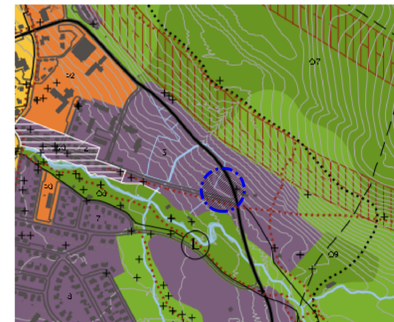
ÚR AÐALSKIPULAGI NORÐURÞINGIS 2010-2025

Ákvæði í greinargerð gildandi deiliskipulags eru óbreytt.