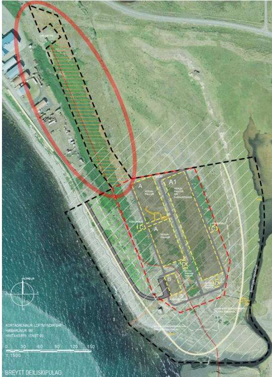
Mynd 1. Í tillögu að breytingu á deiliskipulagi er afmarkað nýtt svæði til vatnstöku.

ársgrundvelli er nú áætluð 980 l/s sem er aukning frá því sem kemur fram í gildandi deiliskipulagi. Á mynd 1 er sýndur uppdráttur deiliskipulagstillögunnar sem verður auglýst samhliða aðalskipulagsbreytingu, þar sem fram kemur hvernig mannvirkjum verður fyrir komið. Dregin er gróf afmörkun utan um áætlað svæði fyrir vatnstökuholur sem þessi aðalskipulagsbreyting nær til.