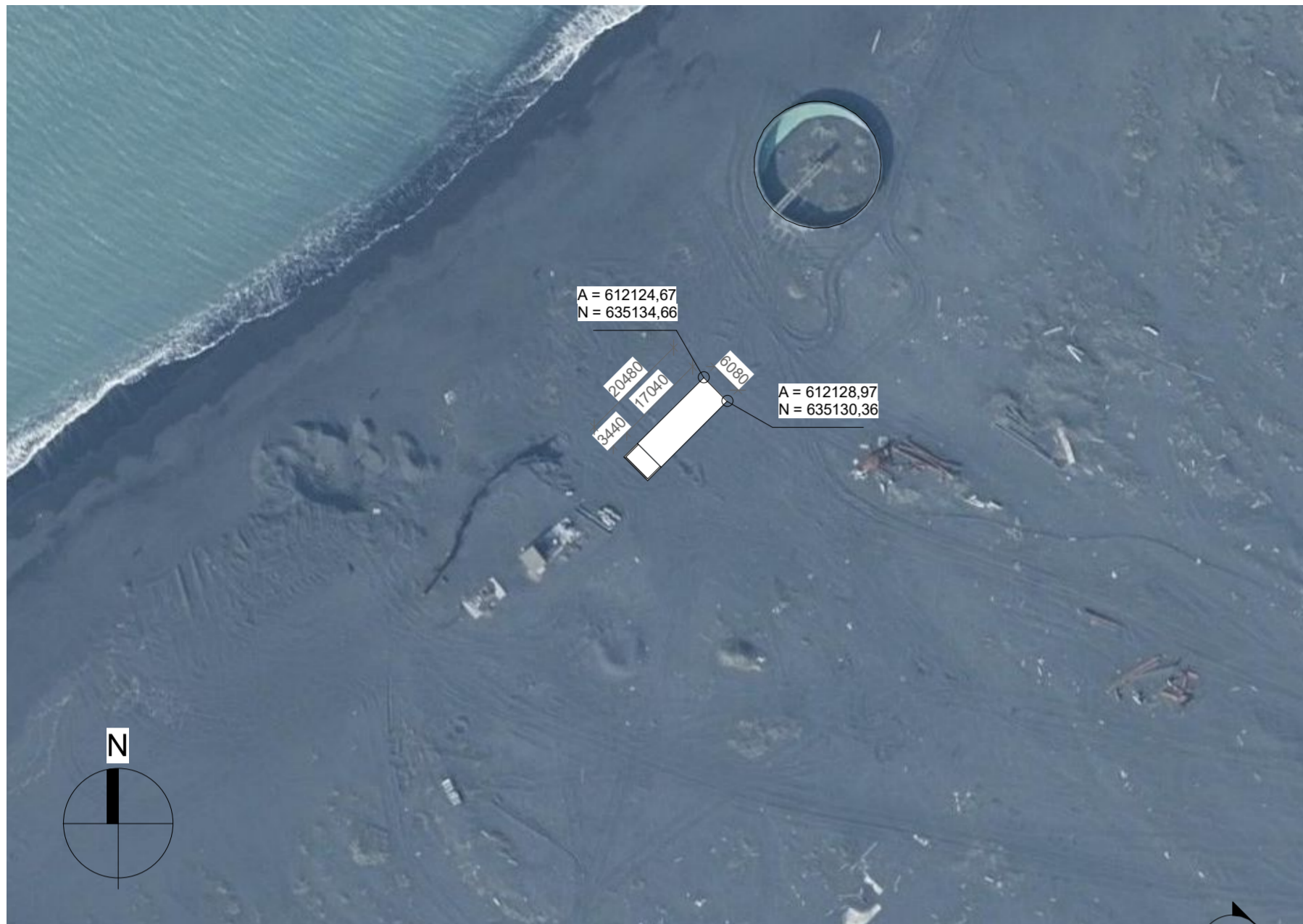
Afstöðumynd 1 : 1000