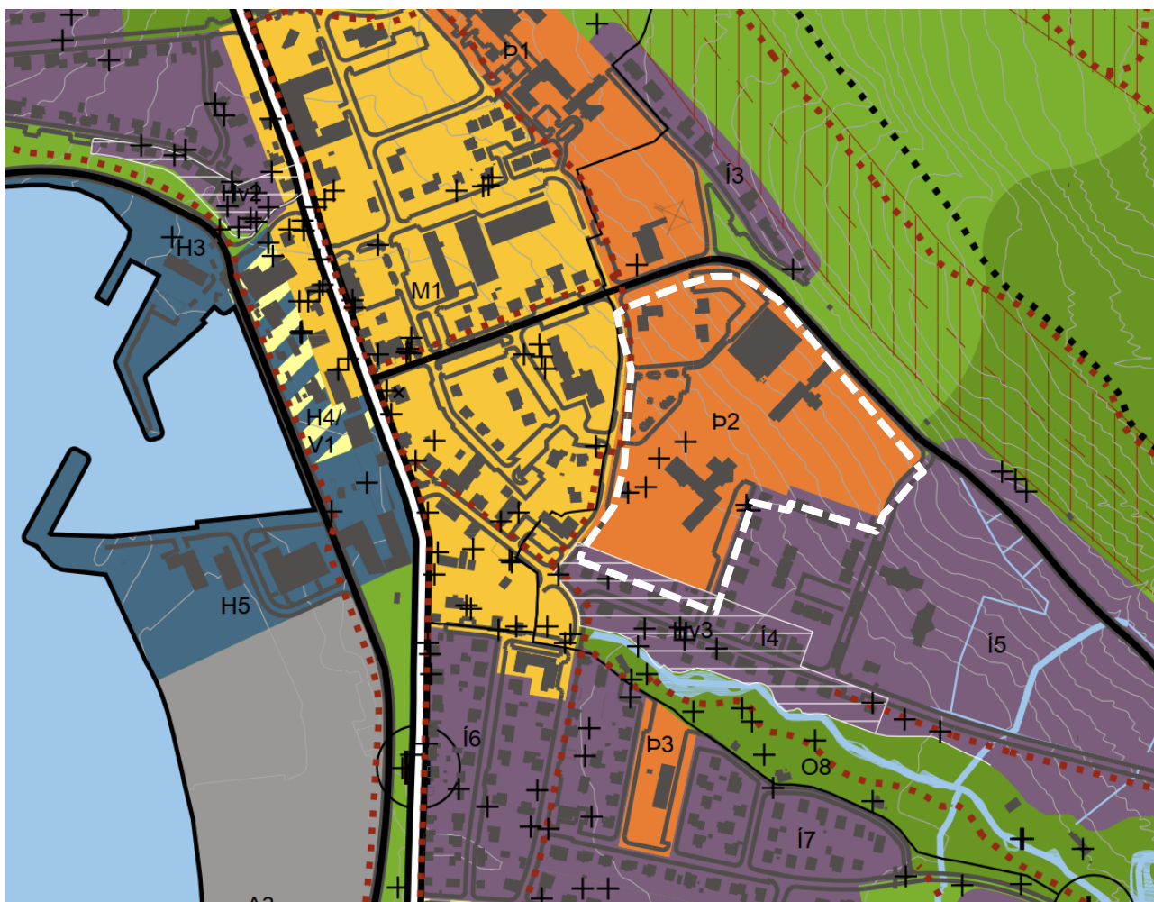
Mynd 2. Hluti Aðalskipulags Norðurþings 2010-2030. Skipulagssvæðið er appelsínugult svæði fyrir þjónustustofnarnir, merkt Þ2 (hvít brotalína).

Á svæðum fyrir þjónustustofnanir skal fyrst og fremst gera ráð fyrir stofnunum og fyrirtækjum sem óháð eignaraðild veita almenna þjónustu við samfélagið, s.s. menntastofnunum, heilbrigðisstofnunum, menningarstofnunum, félagslegum stofnunum, trúarstofnunum, umferðarmiðstöðvum og öðrum þjónustustofnunum ríkis, sveitarfélaga eða annarra aðila. Þéttleiki byggðar á þjónustusvæðum skal taka mið á einkennum núverandi svæða og falla vel að þeim. Að öðru leyti vísast í deiliskipulag.