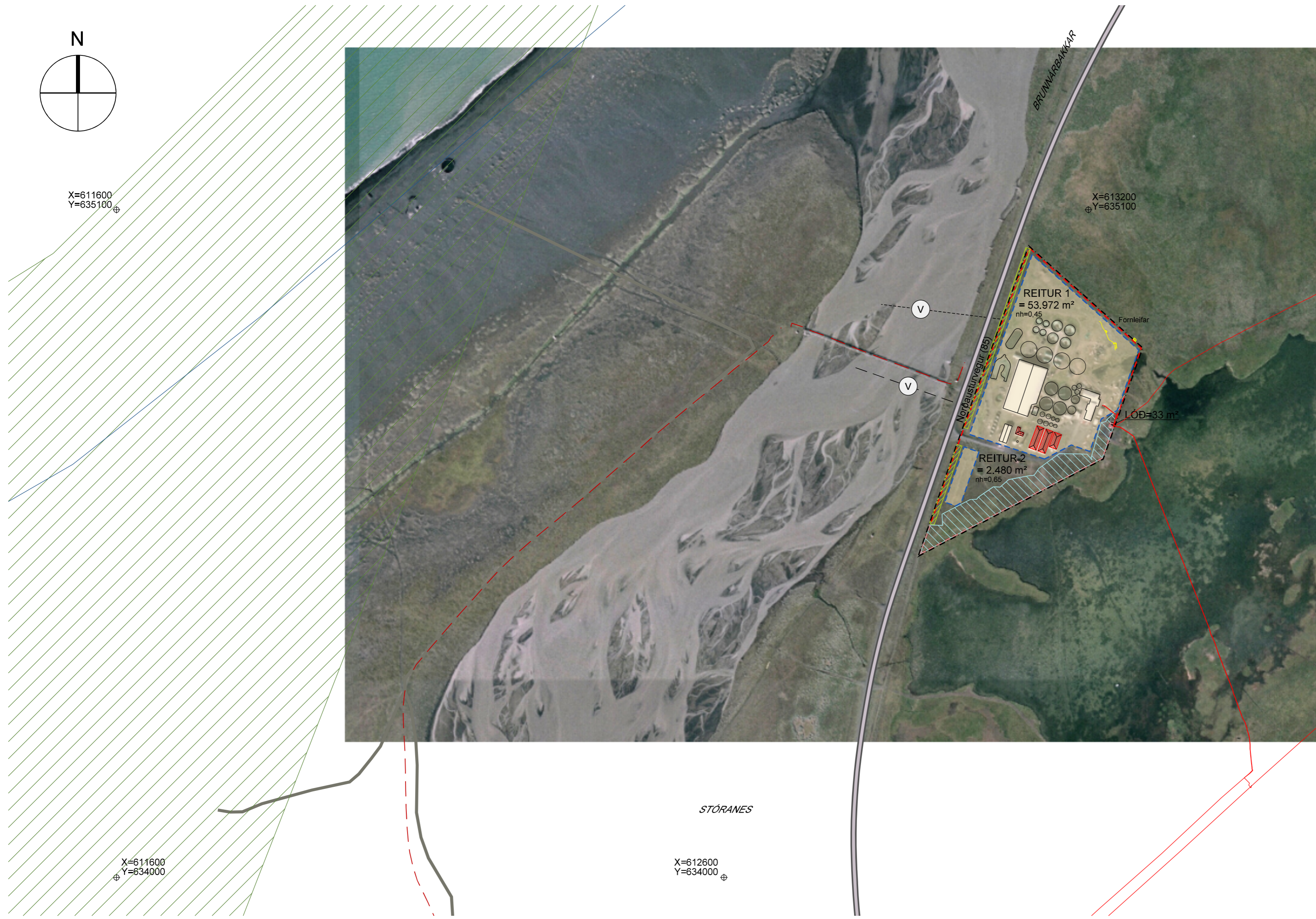
Deiliskipulag fiskeldis á Núpsmýri í Öxarfirði, tók gildi 17.02.2022. Mkv. 1:5.000