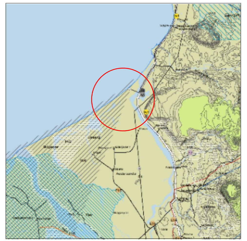
Aðalskipulag Norðurlands 2010-2030, staðfest 22.12.2010.