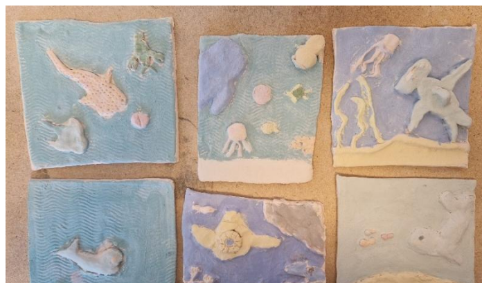
Mynd 2 Þau verk sem búið var að mála með glerungi