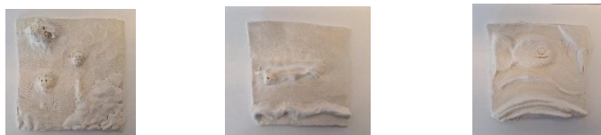
Mynd 3 Stykki eftir hrábrennslu

Verkefnið gekk vel fyrir sig og nemendur voru áhugasamir. Því miður hefur dregist að klára verkefnið vegna þess að skipt var um hópa í list- og verkgreinum eftir að hrábrennslu lauk og hafa því ekki allir nemendur náð að setja glerung á verkin sín. Hér fyrir neðan má þó sjá nokkrar myndir af afrakstri þeirra sem og kennsluáætlun fyrir verkefnið.