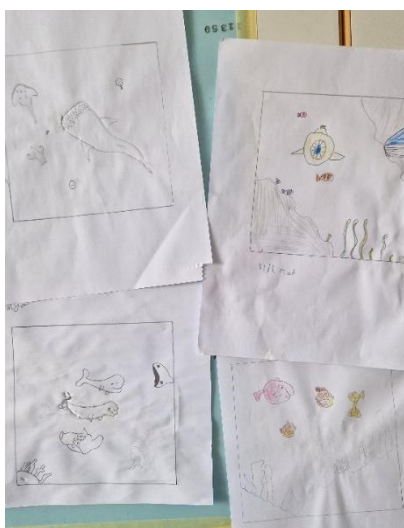
Mynd 4 Nokkrar teikningar nemenda