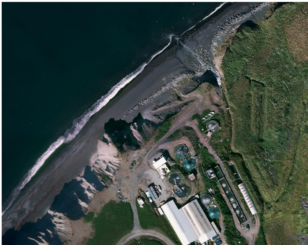
Mynd 3. Fjaran á loftmynd frá 2020. Stórgrýtið er varnargarður.

Fjaran flokkast sem sandstrandarvist samkvæmt vistgerðarkorti Náttúrufræðistofnunar Íslands. Lítil sem enginn gróður er í fjörunni vegna mikils ágangs sjávar. Frárennslið rennur niður í fjöruna. Reynt hefur verið nokkrum sinnum að leiða lögn frá eldisstöðinni niður fyrir stórstraumsfjöru. Hafaldan gengur upp í hamrana og hefur átt sér stað allnokkur landeyðing og þær frárennislagnir sem hafa verið lagðar fram að þessu hafa ekki staðist álag frá sterkum haföldum. Talið er að meðal ölduhæð geti orðið þegar mest er allt að 4-6 m svolítið frá landi en um 3-4 m þar sem aldan brotnar í fjörunni 2 . Varnargarðar hafa verið byggðir við sjávarkambana allt frá höfninni í Húsavík inn fyrir Fiskeldið Haukamýri og hafa þeir gefið sig á nokkrum stöðum. Grjóti í varnargarði sem komið var fyrir framán við fráveitu Fiskeldis Haukamýri hefur hreyfst til og dreift úr sér með þeim afleiðingum að varnargarðurinn hefur gefið sig á kafla eins og sjá má á Mynd 3. Einnig sést á loftmyndinni að það er bratt niður í fjöruna, byggingarnar eru í um 12m.y.s. eða hærra. Sjá einnig mynd 4.