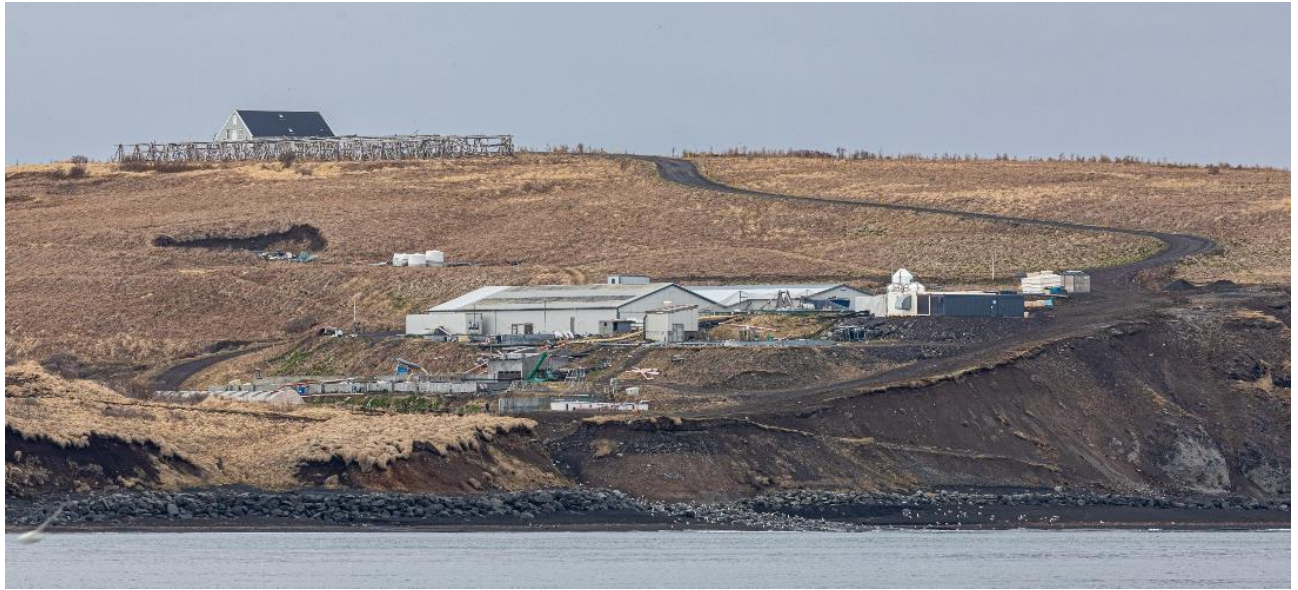
Mynd 4. Séð yfir að fiskeldinu Haukamýri.