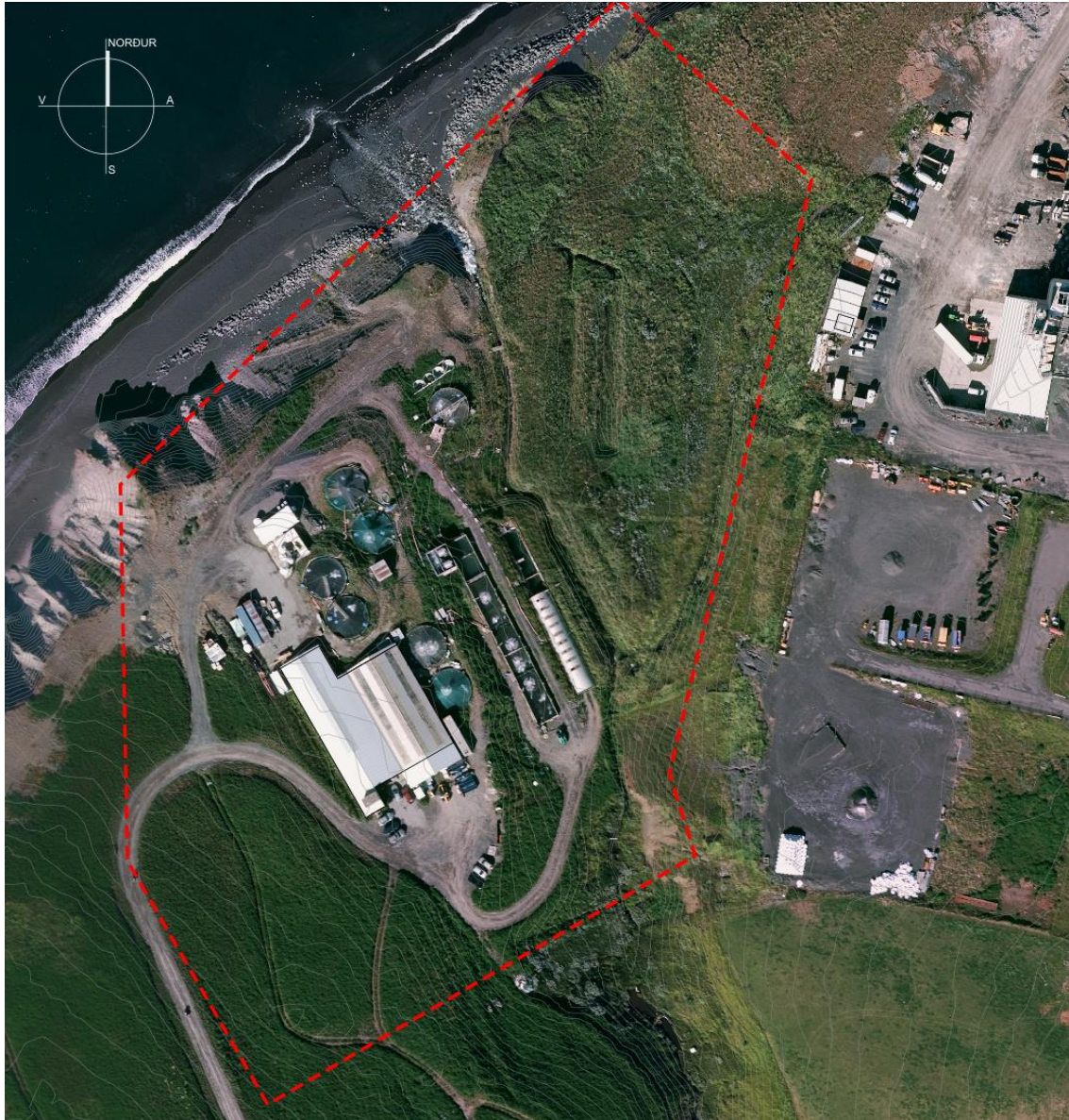
Mynd 1. Rauð afmörkunin sýnir skipulagssvæðið fyrir fiskeldisstöðina Haukamýri.