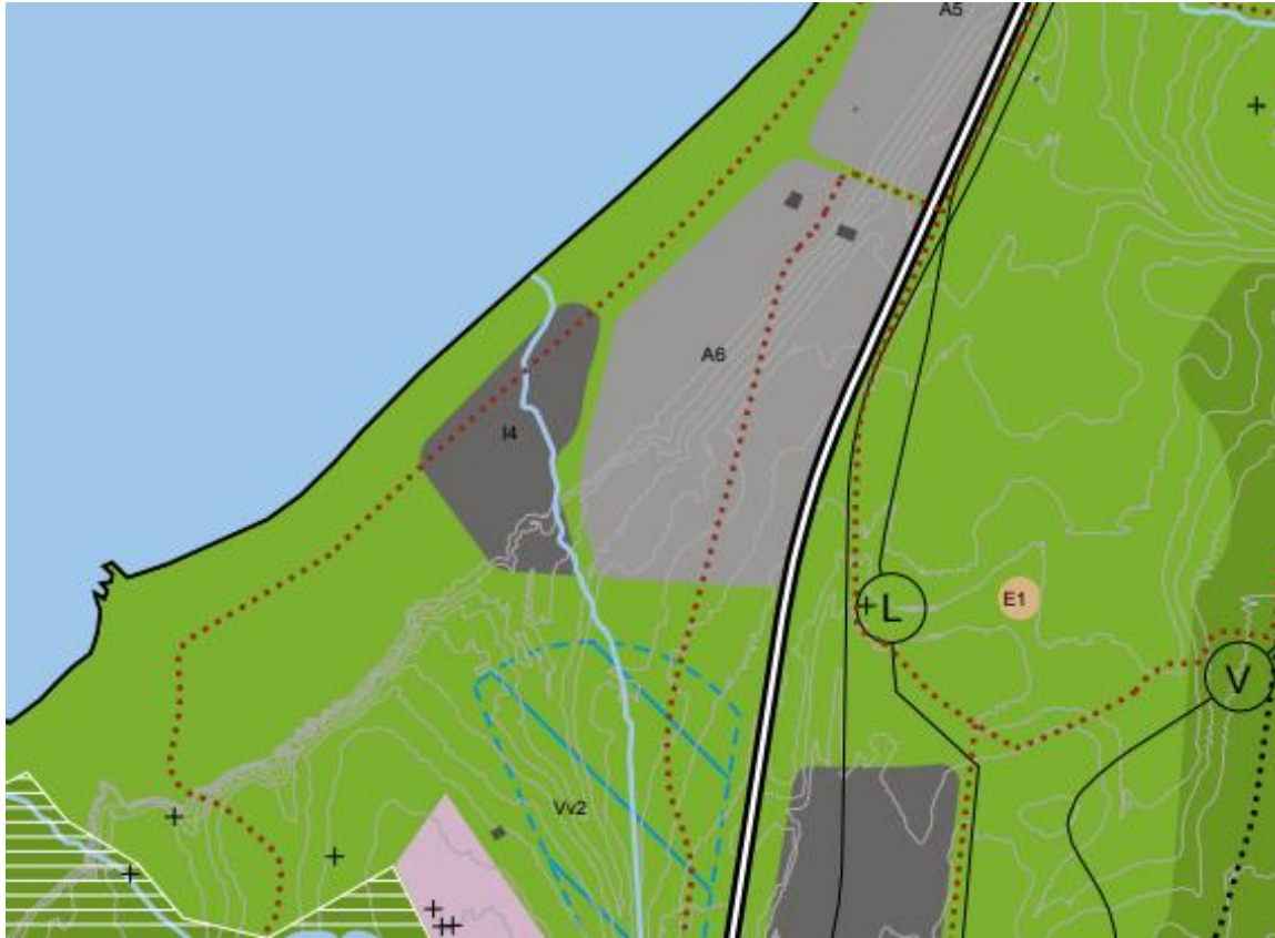
Mynd 6. Úr Aðalskipulagi Norðurbings 2010-2030. Krossar tákna minjar.

Þær byggingar sem eru á svæðinu eru byggðar 1980 eða síðar og fellur engin þeirra undir lög um menningarminjar. Listi yfir núverandi byggingar ásamt stærð og byggingarári er í kafla 2.1.