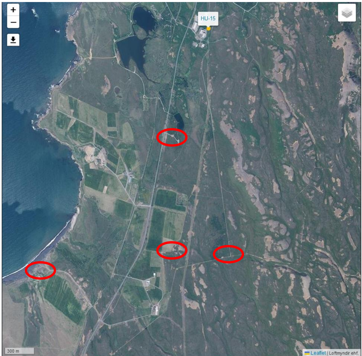
Mynd 1. Staðsetning fyrstu holnanna í Saltoíkurlandi sunnan við Húsavík. Hóla HU-15 er við Orkustöðina í jarðri kaupstaðarins.