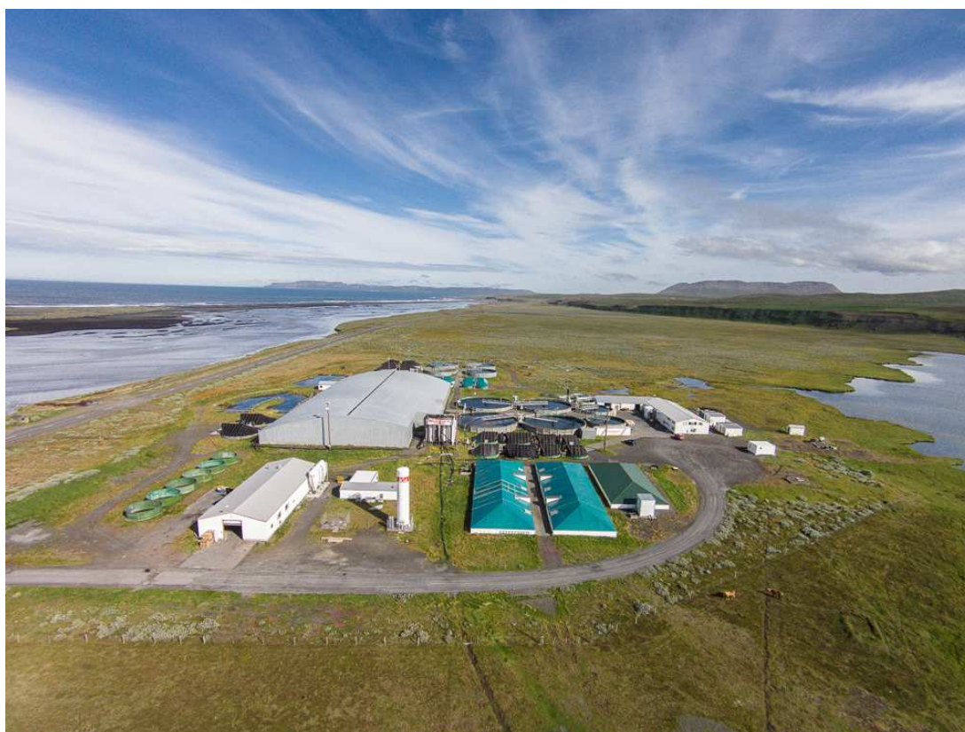
Mynd 5. Yfirlitsmynd yfir svæðið, horft til norð-austurs. Mynd: Samherji fiskeldi ehf. 2016.