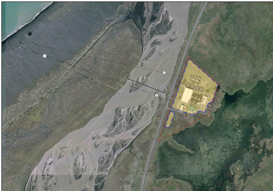
Mynd 1. Loftmynd af svæðinu. Gul skyggða svæðið með blárrí punktalínu er iðnaðarsvæðið. Rauða punktalínan er deiliskipulagsmörkin. Neðri svarta punktalínan sýnir núverandi stofnlögn vatnsveitu/sjólögn, efri punktalínan sýnir fyrirhugaða nýja sjólögn. Sjólagnir eru niðurgrafnar.

Iðnaðarsvæðið i3 að Núpsmýri er um 15 km suður af Kópaskeri og um 18 km norður af þjónustumiðstöðinni við Ásbyrgi. Svæðið liggur meðfram Norðausturvegi (85), sjá Mynd 1. Brunná rennur út í Öxarfjörðinn vestan við veginn. Suð-austan við svæðið er Núpsvatn og þar fyrir aftan rís Öxarnúpur. Landið neðan við fjallsbrúnina er slétt. Svæðið er mýrlent en hefur þornað nokkuð á undanförunum áratugum. Svæðið er grösugt og lyngvaxið. Loðvíðir er orðinn áberandi. Brunná er jökulá með talsverðum framburði og er árfarvegur sendinn og leirkenndur. Árósar eru við Svelting og rennur út í Buðlungahöfn. Núpsvatn er grunnt vatn þar sem nokkuð er um vaðfugla og andfugla, þar á meðal álftir og gæsir. Núpsvatn og aðliggjandi votlendi eru friðuð samkvæmt 61. gr. laga um náttúruvernd nr. 60/2013 og má því ekki raska. Tillaga Náttúrufræðistofnunar Íslands um verndarsvæði við Öxarfjörð vegna mikils og fjölbreytts fuglalífs nær ekki beint til lóðarinnar, en stofnunin hefur bent á að það svæði ætti með réttu að ná yfir Núpsvatn og Núpsmýri. Fiskeldisstöðin hefur verið starfrækt þarna frá árinu 1988 eða í 33 ár.