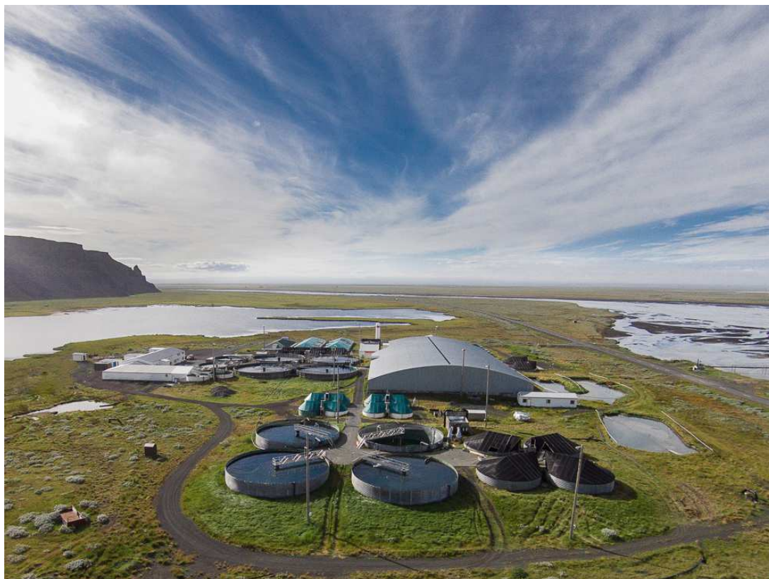
Mynd 4. Yfirlitsmynd yfir svæðið, horft til suð-vesturs.